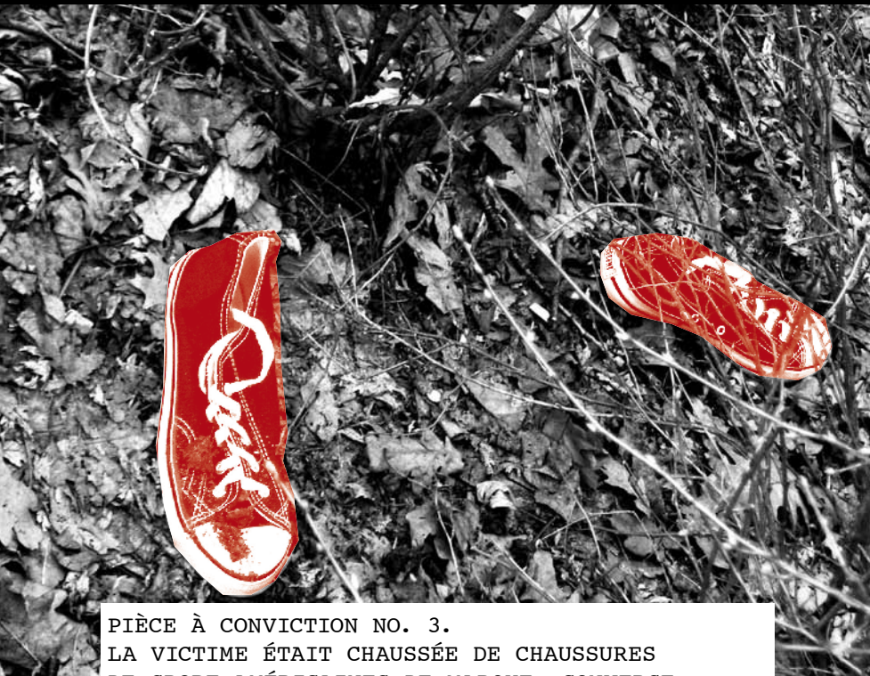
PIÈCE À CONVICTION NO. 3. LA VICTIME ÉTAIT CHAUSSÉE DE CHAUSSURES DE SPORT AMÉRICAINES DE MARQUE «CONVERSE», SIGNE D'ATTACHEMENT À LA CULTURE OCCIDENTALE.