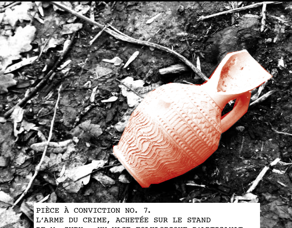
PIÈCE À CONVICTION NO. 7. L'ARME DU CRIME, ACHETÉE SUR LE STAND DE M. ZUPY ; UN VASE FOLKLORIQUE D'ARTISANAT POPULAIRE POLONAIS FABRIQUÉ EN CHINE.