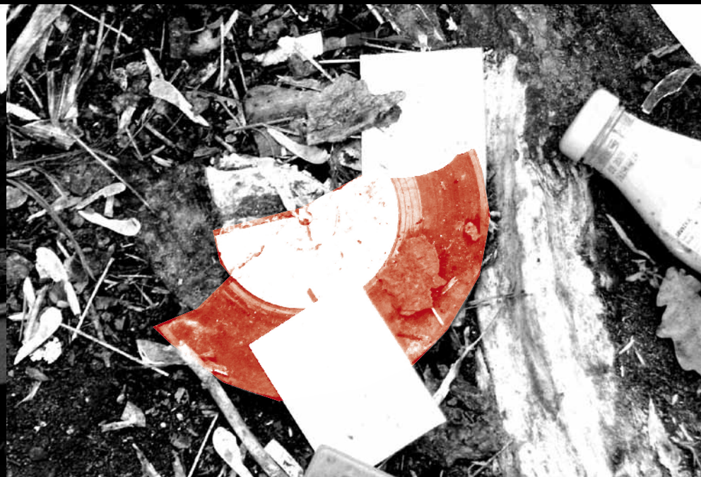
PIÈCE À CONVICTION NO. 6. IDEM POUR SON COMPAGNON, QUI ENTRETIENT POUR SA PART UN EUROPÉISME MOINS CULTUREL (POSSESSION D'UN DISQUE DU CHANTEUR FRANCO-BELGE JOHNNY HALLYDAY).