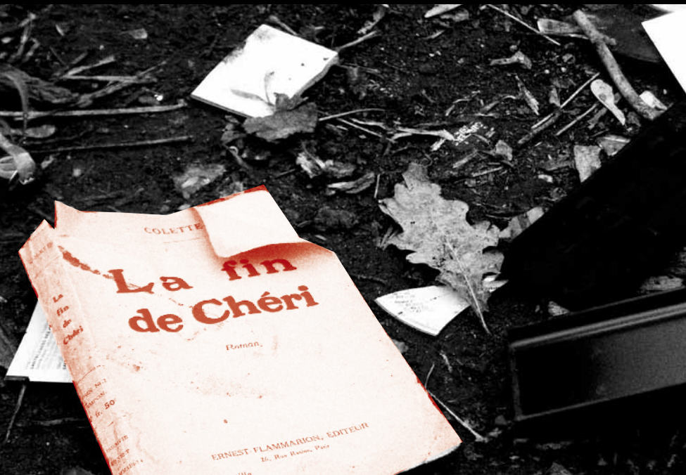
PIÈCE À CONVICTION NO. 5. LA VICTIME CONFIRME SON GOÛT POUR LA CULTURE NON-POLONAISE EUROPÉISTE (POSSESSION D'UN LIVRE FÉMINISTE FRANÇAIS DU VINGTIÈME SIÈCLE).