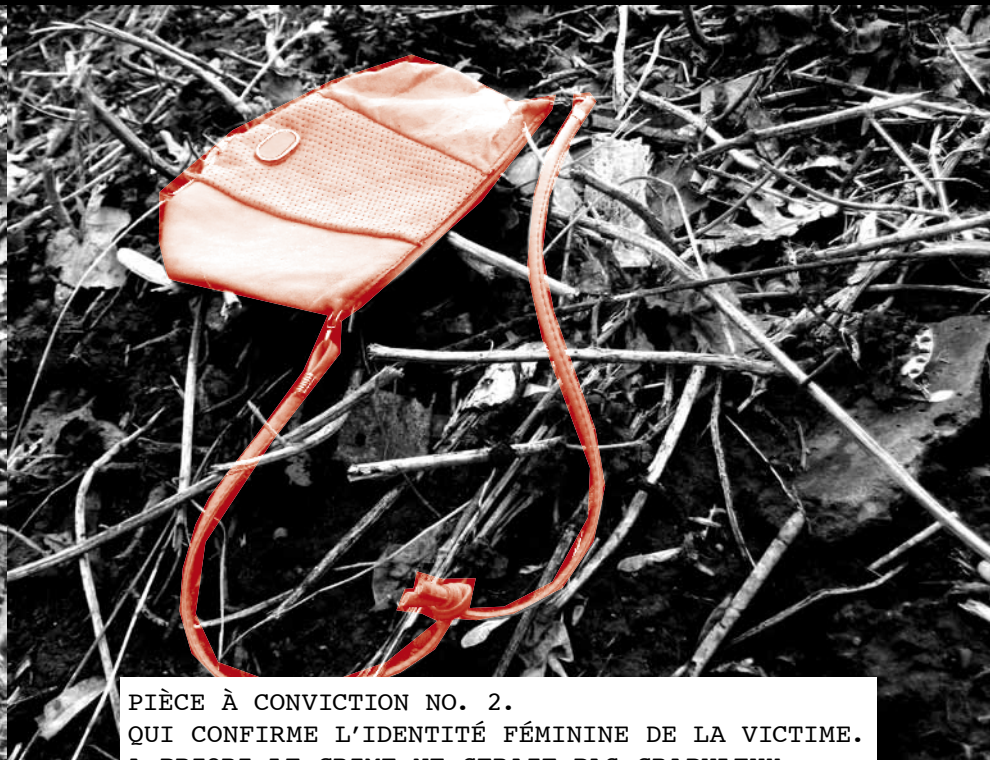
PIÈCE À CONVICTION NO. 2. QUI CONFIRME L'IDENTITÉ FÉMININE DE LA VICTIME. A PRIORI LE CRIME NE SERAIT PAS CRAPULEUX, LE SAC À MAIN AYANT ÉTÉ ABANDONNÉ AVEC LA TOTALITÉ DES 20 GROSZYS QU'IL CONTENAIT.