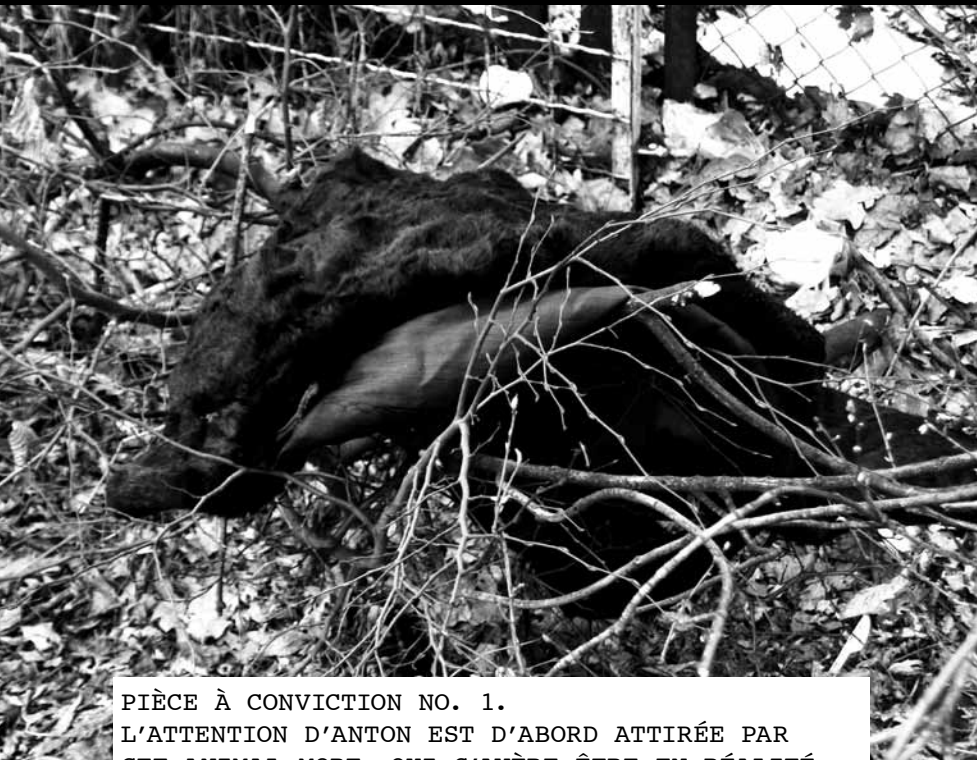
PIÈCE À CONVICTION NO. 1. L'ATTENTION D'ANTON EST D'ABORD ATTIRÉE PAR CET ANIMAL MORT, QUI S'AVÈRE ÊTRE EN RÉALITÉ L'UN DE CES MANTEAUX DE FOURRURE SYNTHÉTIQUE QUE MME PIEROGI VEND AU KILO CHAQUE DIMANCHE.